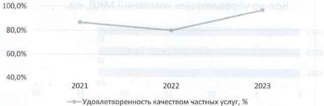
Рисунок 3 – удовлетворенность качеством частных услуг по годам

По итогам ежегодного опроса оценка качества услуг УК увеличилась на 16,6%, что является следствием смены части управляющих компаний в МКД за последний период ввиду передачи жилфонда из организаций с низким рейтингом в действующие на рынке УК. При стабильной ситуации на рынке в следующем году, оценка качества услуг должна быть более 70%.