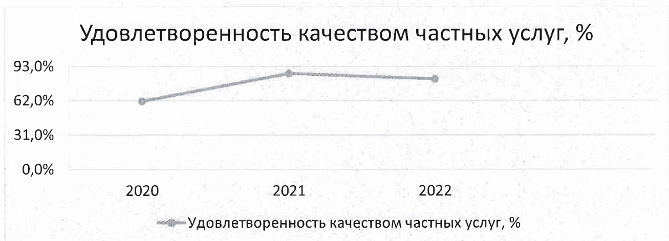
Рисунок 4 – удовлетворенность качеством частных услуг по годам

Оценим динамику ответов за период 2020-2022 годы.